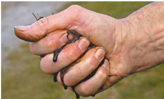
Le compost doit être humide (comme une éponge pressée) mais sans excès. Si du liquide sort d'une poignée de compost pressée, il est trop humide.

Trop d'humidité empêche l'aération : le compostage est freiné et des odeurs désagréables se dégagent. Si c'est le cas, on peut étaler le compost quelques heures au soleil ou le mélanger avec du compost sec ou de la terre sèche. Pas assez d'humidité : les déchets deviennent secs, les micro-organismes meurent et le processus s'arrête. Il faut alors arroser le compost.