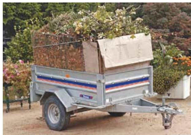
Réduire la production de déchets verts et les utiliser pour pailler votre jardin ou fabriquer du compost vous évite des déplacements en déchèterie.

en jouant sur des techniques de jardinage : moins d'engrais et d'arrosages pour limiter la croissance des plantes ; tontes, feuilles et brindilles laissées sur place ; diminution du nombre de tontes (mise en place de prairies fleuries, tontes sur certaines zones du jardin seulement...).