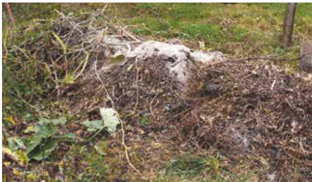
Le compostage en tas est pratique si vous disposez de place mais de peu de temps à y consacrer.