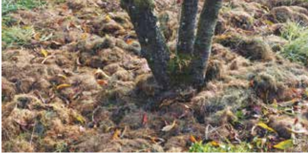
De la tonte de gazon est épanchée au pied d'un arbre.

Il exige peu de temps et vous évite les déplacements en déchèterie.