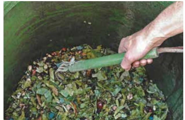
Le brassage des déchets est une des conditions de la réussite d'un compost.

réaliser un brassage régulier (notamment au début du compostage lorsque l'activité des micro-organismes est la plus forte, puis tous les 1 à 2 mois). Le brassage permet de décompacter le compost, de l'aérer et d'assurer une transformation régulière .