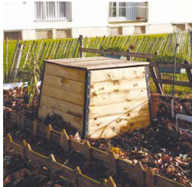
La pratique du compostage partagé se développe de plus en plus.

Dans votre immeuble, votre résidence ou votre quartier; parlez-en autour de vous pour savoir si des habitants voudraient participer; mobilisez vos voisins, c'est un des gages de réussite d'une telle opération.