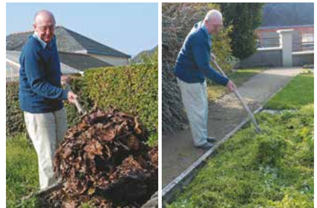
Il est possible de pailler avec des feuilles mortes ou des herbes fraîches.

des salissures, pour les fruits et légumes (paillage des fraisiers...).