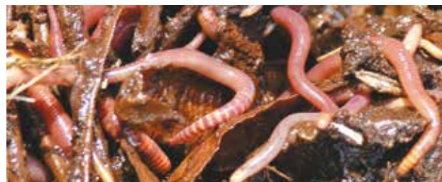
Des vers de fumier, cheville ouvrière du lombricompostage.

Attention, les lombrics provenant de la terre d'un jardin ne conviennent pas pour le lombricompostage.