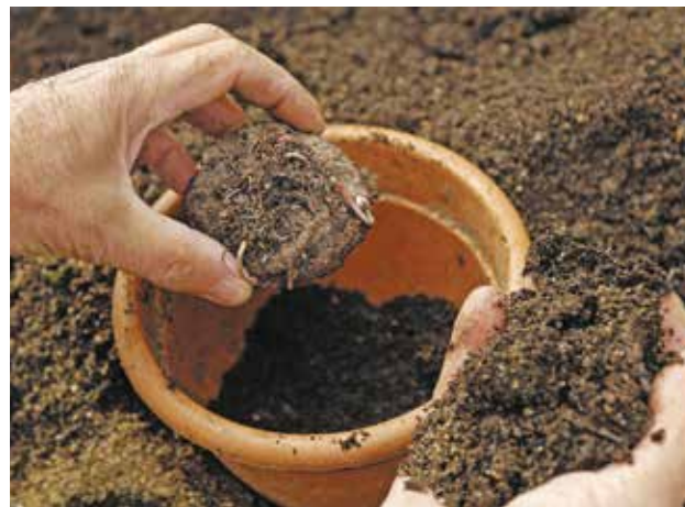
Le compost doit être mélangé avec de la terre quand il est utilisé en support de culture.

Pour la création de nouvelles jardinières, un bon mélange est constitué d' un tiers de compost, un tiers de terre et un tiers de sable . Si vous réutilisez des jardinières de l'année précédente, vous rajouterez 20 % maximum de compost à la quantité de l'ancienne terre. Vous pouvez aussi l'utiliser pour vos plantes d'intérieur de la même façon.