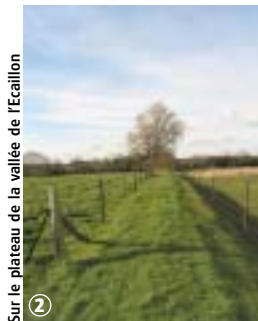
Sur le plateau de la vallée de l'Ecaillon