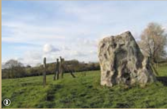
Le Menhir ou « Gros Caillou »

Tout le monde le sait, c'est bien connu ! Les filles naissent dans les roses et les garçons dans les choux... Et bien détrompez-vous, cette légende n'est pas vraie partout ! A Vendegies-sur-Ecaillon, on racontait aux enfants du village que les mamans allaient chercher les bébés sous la pierre... Mais quelle pierre ? Il s'agit de la Grosse Pierre.