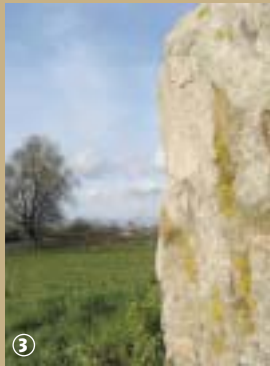
Le Menhir ou « Gros Caillou »

Encore appelée « Gros Caillou » ou « Grès de Montfort », ce bloc de grès, à la forme d'un prisme trapézoïdal, intriguait les petits qui y collaient leur oreille afin d'entendre les bébés pleurer !